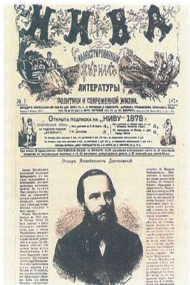
Εξώφυλλο τεύχους του 1878 του ρωσικού λογοτεχνικού περιοδικού Νίβα με προσωπογραφία του Ντοστογιέφσκι