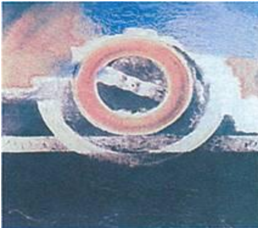
Max Ernst (1891-1976), Η ρόδα του ήλιου (1926)