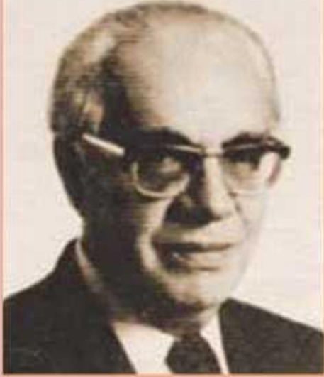
Άγγελος Αγγελόπουλος, Διοικητής Εθνικής Τράπεζας.

Δύο από τους αρχιτέκτονες του μεταπολεμικού οικονομικού θαύματος της Ελλάδας.