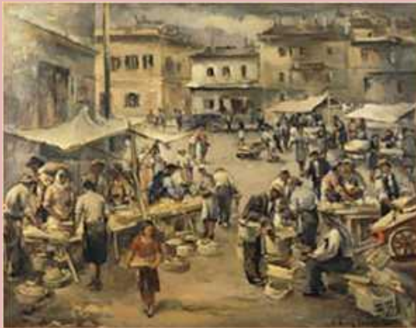
Γιάννης Σπυρόπουλος, Λαϊκή αγορά II, 1943.