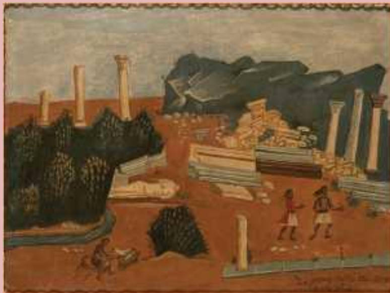
Φώτης Κόντογλου, Η Ελλάδα των τριών κόσμων, 1923.

«Η Ελλάδα έχει μια μοναδική ευκαιρία. Μην ξεχνάτε ότι η χώρα σας βρίσκεται σε στρατηγικό σημείο στη Νοτιοανατολική Μεσόγειο. Η Ελλάδα βρίσκεται σε μια πολύ ισχυρή θέση, γιατί η Νοτιοανατολική Μεσόγειος θα είναι ένα από τα παγκόσμια ενεργειακά κέντρα μέσα στα επόμενα είκοσι χρόνια.» (Ρ. Χόρματς, Συνέντευξη, εφ. Το Βήμα, 9 Μαρτίου 2014)