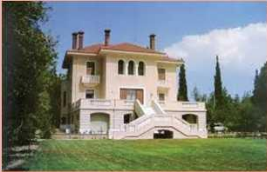
Ελληνικό Ίδρυμα Πολιτισμού, (Ψυχικό - Οικία Μποδοσάκη).