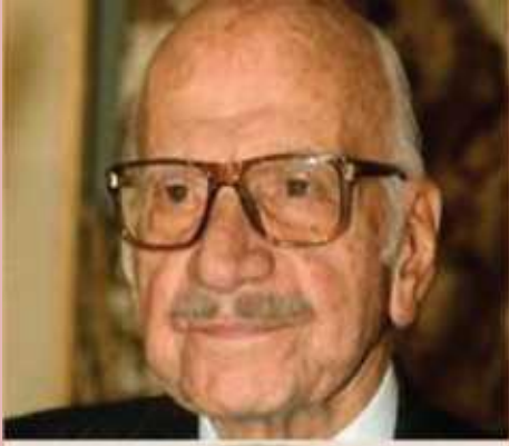
Ξενοφών Ζολώτας, Διοικητής Τράπεζας Ελλάδος.