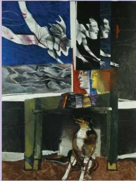
Δημήτρης Μυταράς, Εργαστήριο, 1993.