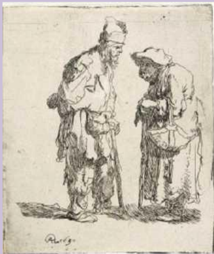
Ρέμπραντ, Ζητιάνοι, 1630.

Επίσης, υποβάλλονται και γίνονται υποχρεωτικά αποδεκτά ευκρινή φωτοαντίγραφα από αντίγραφα εγγράφων που έχουν εκδοθεί από αλλοδαπές αρχές και έχουν επικυρωθεί από δικηγόρο.