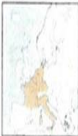
1957: Ίδρυση της ΕΟΚ από τη Γαλλία, Γερμανία, Ιταλία, Βέλγιο και Λουξεμβούργο