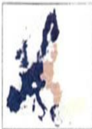
2004: Προσχώρηση Κύπρου, Τσεχίας, Εσθονίας, Ουγγαρίας, Πολωνίας, Σλοβενίας, Σλοβακίας, Λετονίας, Λιθουανίας και Μάλτας. 2007: Προσχώρηση Βουλγαρίας και Ρουμανίας, Υποψήφιες χώρες: Τουρκία και Κροατία