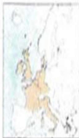
1981: Προσχώρηση της Ελλάδας