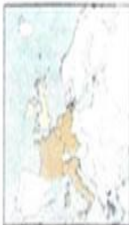
1973: Προσχώρηση Αγγλίας, Ιρλανδίας και Δανίας