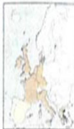
1986: Προσχώρηση Ισπανίας και Πορτογαλίας