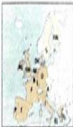
1994: Προσχώρηση Αυστρίας, Σουηδίας και Φινλανδίας